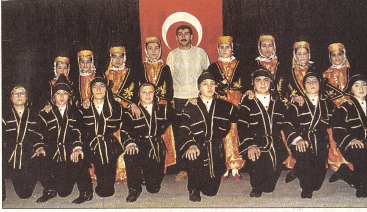
Rauf Orbay İlköğretim Okulu'nun halkoyunları ekibi, yarışmalarda okulu başarıyla temsil ediyor