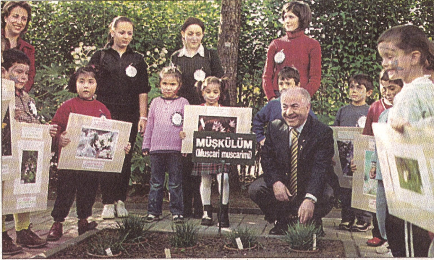
Nesilleri tükenmeye başlayan soğanlı bitkiler, Kadıköy Belediyesi tarafından Özgürlük Parkı'nda üretilecek...

vatandaşlar kitaplarını Gazete Kadıköy, Kadıköy Belediyesi Basın Danışmanlığı ve tüm muhtarlıklara bırakabilirler.