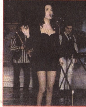
1997'deki Eurovision yarışmasından bir görüntü

Sevgi, Güven, Aşk: Sınırsız ve tehlikeli, Aile: Sıcaklık, Dost: Kalıcı, Hayat: Belirsiz, Ölümlü: Kaçınılmaz, Müzik: Tutku