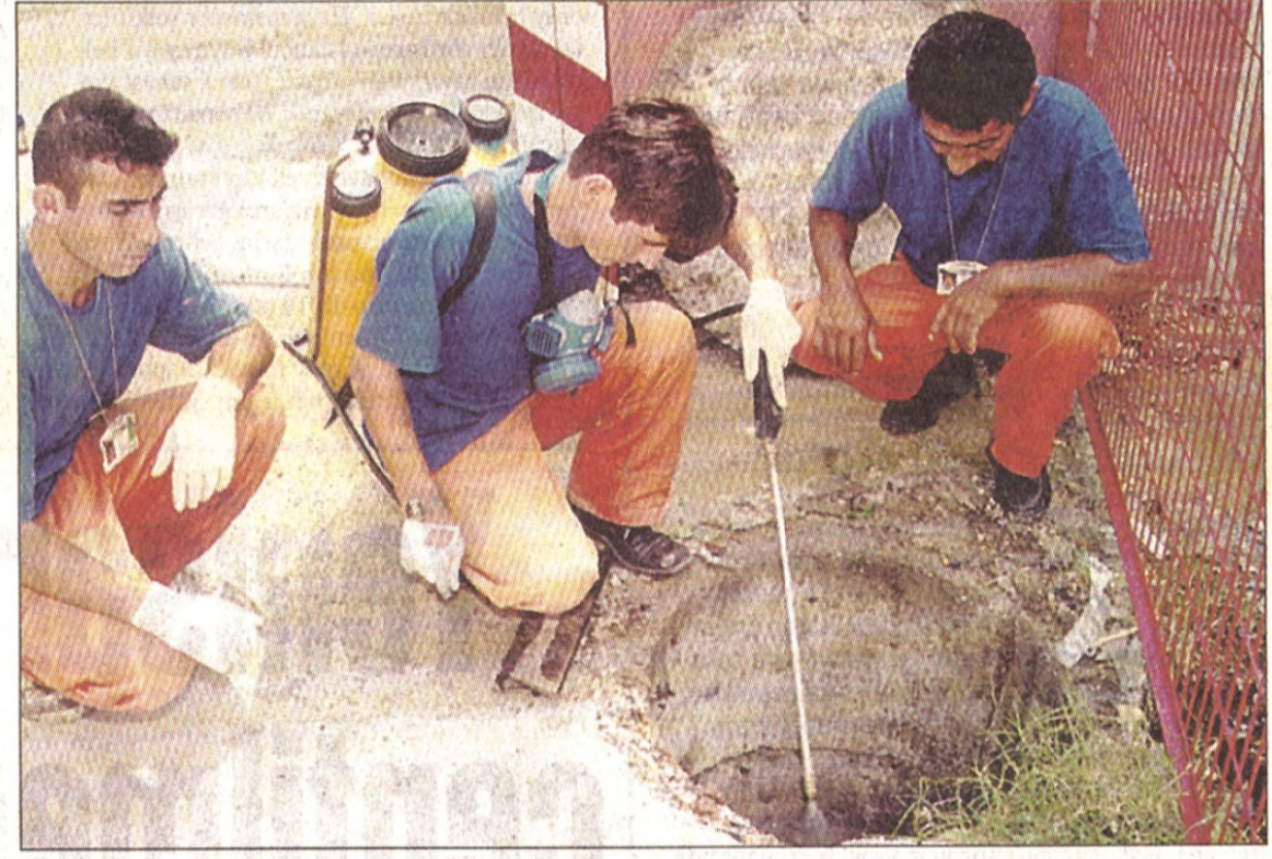
Fosseptiklerinizi en kısa sürede iptal ettirin....

■ Kullandığımız fosseptikleri en kısa zamanda iptal ettirerek, kanalizasyona direkt bağlantı yaptırın.