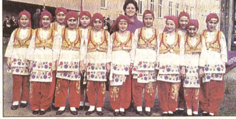
Halkoyunları ekibi Artvin ve Kırklareli yörelerinde başarılı..