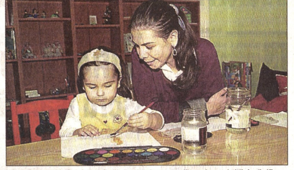
Psk.Sönmemiş, zekânın küçük yaşlarda test edilmesi gerektiğini söylüyor