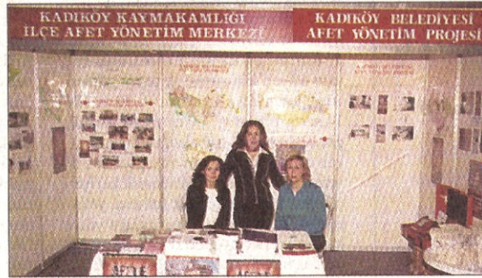
Kadıköy Belediyesi, Afet Fuarı'nda stand açtı...

2. Uluslararası Afet Fuarı'na; aralarında İstanbul Valiliği ile İstanbul Büyükşehir Belediyesi'nin de bulunduğu birçok kamu kuruluşunun yanı sıra sivil toplum örgütleri de katıldı.