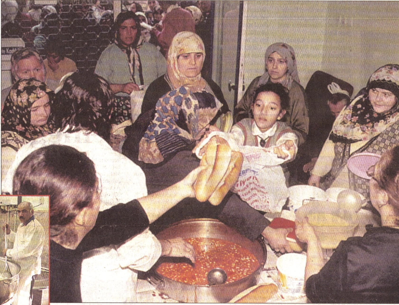
Bu bayramda fitre ve zekatlarınızın adresi Aile Danışma Merkezi olsun. Onların buna çok ihtiyacı var.